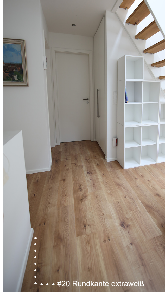
••• #20 Rundkante extraweiß